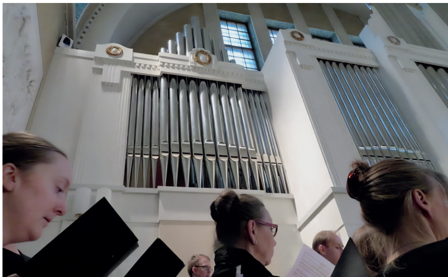
Kallion Kantaattikuoro esiintymässä Kallion kirkon urkuparvella.