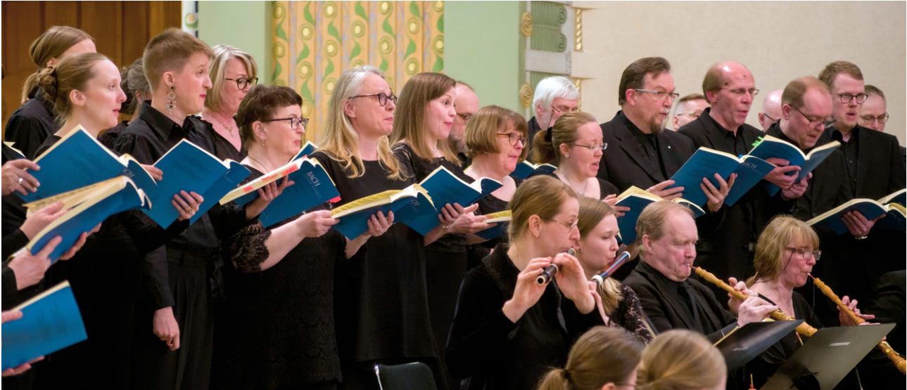
Vuonna 2019 toteutui kuorolaisten pitkäaikainen haave, kun esitimme J.S. Bachin Johannes-passion ensin Alajärvellä ja sitten Kallion kirkossa.

huomiota kyyneliin liikuttuneeseen iäkkääseen maahanmuuttajaan. Toivon sydämestäni, että kyyneleet tulivat kauniin musiikin herättämistä hyvistä muistoista.