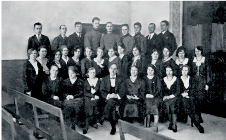
Kallion kirkkokuoro 1920-luvulla