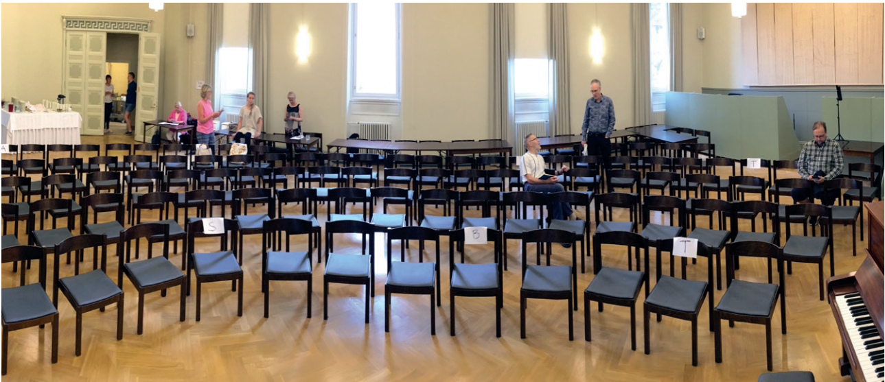
Kuoroharjoituksen kalustus seurakuntakodissa.

LÄHDE: Ritva Wäreén artikkeli Kalliolle rakennettu kirjassa Tälle kalliolle, Kallion kirkon 100 vuotta, toimittanut Salla Korpela, 2012.