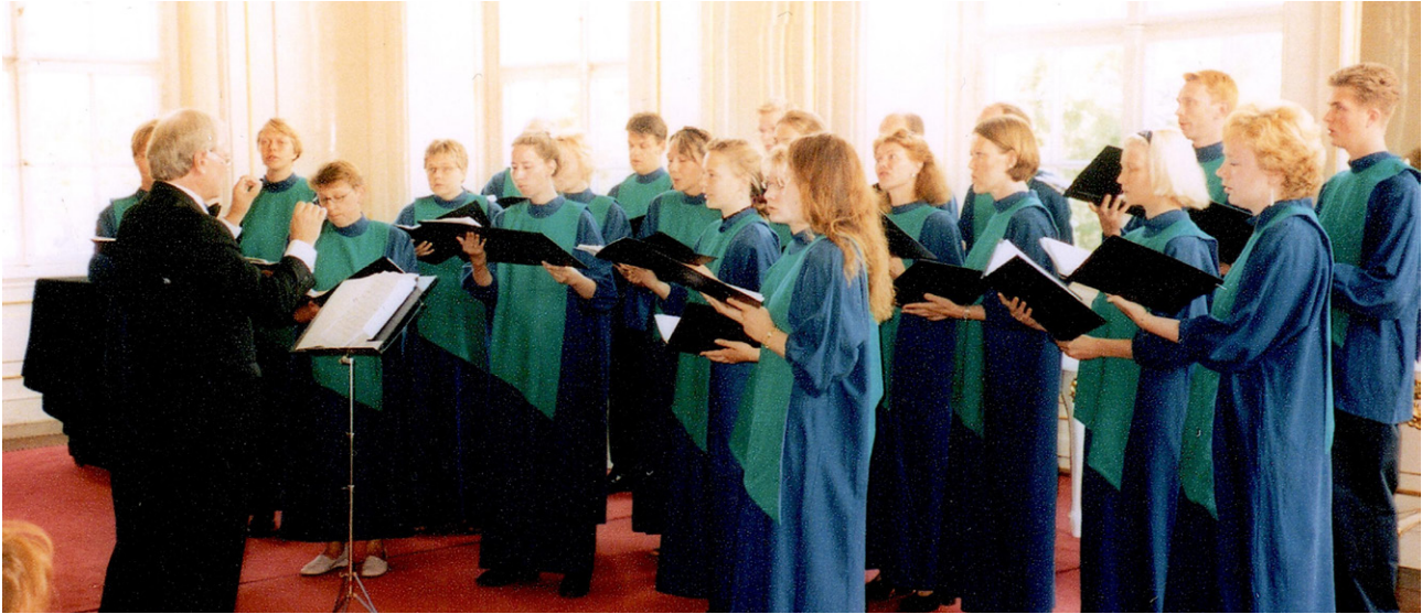
Vuonna 2000 kuoro esiintyi Unkarin matkallaan mm. Sissin linnassa. Siniset villakaavut olivat vuosien ajan Kallion Kantaattikuoron tavaramerkki.

Minä hyppäsin takarivistä korkeimmalta korkeelta lattialle ja poistuin sakastin ovesta, ja ehdin töihin, juuri ja juuri.